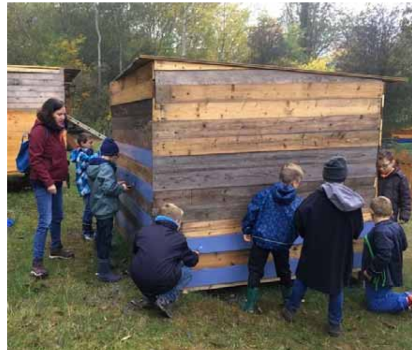
Kinder- und Jugendfarm

Um sich zu speziellen Fragen einen eigenen Eindruck zu verschaffen und um z.B. Einrichtungen entsprechend in Prozesse einzubinden, werden seitens der Sozialplanung bei Bedarf Visitationen durchgeführt.